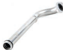
TUBO DE FLUXO DE LÍQUIDO DE ARREFECIMENTO

CRUZE 1.8 L 16V L4 (ECOTEC 6) FLEX 12/16 TRACKER 1.8 L 16V L4 (ECOTEC 6) FLEX 13/16 SONIC 1.6 L 16V L4 (ECOTEC) FLEX 12/14