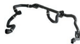
MANGUEIRA COM O TUBO DO AQUECEDOR-

SERIE 1 3.0 L 24V DOHC L6 (N66) GASOLINA 07/13 SERIE 3 3.0 L 24V DOHC L6 (N66) GASOLINA 07/12