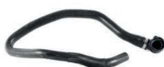
MANGUEIRA INFERIOR DO RADIADOR

JUMPY 1.6 L 8V SOHC L4 (BLUEHD) DIESEL 19/25 EXPERT 1.6 L 8V SOHC L4 (BLUEHD) DIESEL 17/25