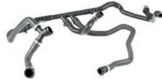
MANGUEIRA COM TUBO DO AQUECEDOR

X1 2.0 L 16V DOHC L4 GAS/FLEX 12/18 320I 2.0 L 16V DOHC L4 GAS/FLEX 06/18