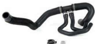
MANGUEIRA INFERIOR DO RADIADOR

208, 308, 408 1.6 L 16V L4 (EP6CDT) 12/20 2008, 3008 1.6 L 16V L4 (EP6CDT) 15/25 C4, C4 CACTUS 1.6 L 16V L4 (EP6CDT) 13/25 DS3, DS4, DS5 1.6 L 16V L4 (EP6CDT) 12/20