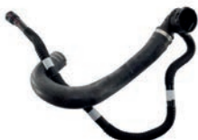
MANGUEIRA INFERIOR DO RADIADOR

VM-2001.A FIAT JEEP 52129214 52163252 51989734