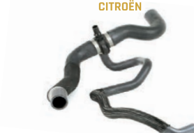
MANGUEIRA INFERIOR DO RADIADOR COM TRANSMISSÃO AUTOMÁTICA

C4 2.0 L 16V DOHC L4 (EW10A) FLEX/GAS. 09/18 307 2.0 L 16V DOHC L4 (EW10A) FLEX/GAS. 04/13 408 2.0 L 16V DOHC L4 (EW10A) FLEX/GAS. 11/16