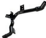
TUBO DE FLUXO DE LÍQUIDO DE ARREFECIMENTO PARA VEÍCULOS C/ TRSMISSÃO MANUAL

AIRCROSS 1.5, 1.6 L 8V L4 FLEX 10/25 C3 1.5, 1.6 L 16V L4 FLEX/GASOLINA 05/21 C4 CACTUS/LOUNGE 1.6 L 16V L4 FLEX 18/25 208 1.5, 1.6 L 16V L4 FLEX 13/25 HOGGAR/PARTNER 1.6 L 16V L4 FLEX/GAS. 04/21