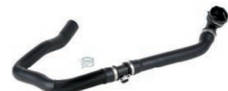
MANGUEIRA SUPERIOR RADIADOR COM SANGRADOR

VM-0023 LAND ROVER VOLVO LR032347 LR094509