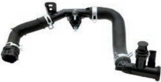
MANGUEIRA TRASEIRA DA BOMBA DA ÁGUA

JUMPY 1.6 L 8V SOHC L4 (BLUEHD) DIESEL 19/25 EXPERT 1.6 L 8V SOHC L4 (BLUEHD) DIESEL 17/25