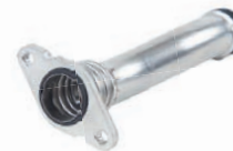
TUBO DE FLUXO DE LÍQUIDO DE ARREFECIMENTO

CRUZE 1.8 L 16V L4 (ECOTEC 6) FLEX 12/16 TRACKER 1.8 L 16V L4 (ECOTEC 6) FLEX 13/16 SONIC 1.6 L 16V L4 (ECOTEC) FLEX 12/14