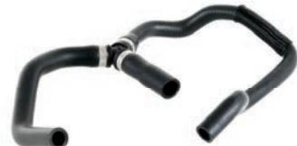
MANGUEIRA RESERVATÓRIO DE ÁGUA AO RADIADOR

VM-0019 FORD 8V218K276AD BE8Z8K276A M8V2Z8K276B