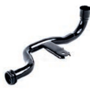
TUBO DO FLUXO DE ÁGUA DO BLOCO DO MOTOR

MASTER 2.5 L 16V DOHV L4 (G9U) DIESEL 04/13