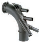
TUBO DE FLUXO DE LÍQUIDO DE ARREFECIMENTO

TRAILBLAZER 2.8 L 16V L4 (DURAMAX) DIESEL 14/19 S10 2.8 L 16V L4 (DURAMAX) DIESEL 14/19