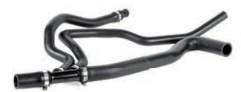
MANGUEIRA INFERIOR DO RADIADOR COM TRANSMISSÃO MECÂNICA

MEGANE 2.0 L 16V DOHC L4 (F4R) GASOLINA 02/10 SCENIC 2.0 L 16V DOHC L4 (F4R) GASOLINA 02/10