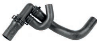
MANGUEIRA DA BOMBA DE ÁGUA AO RADIADOR

GOLF G3 1.6, 1.8, 2.0 L 8V L4 GASOLINA 94/02