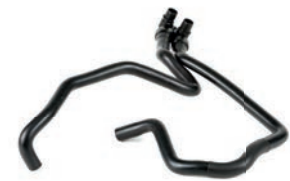
MANGUEIRA DUPLA DO AR QUENTE

BERLINGO 1.8 L 8V L4 (XU7JB) GASOLINA 98/04 PARTNER 1.8 L 8V L4 (XU7JB) GASOLINA 99/04 306 1.8 L 8V L4 (XU7JB) GASOLINA 95/02