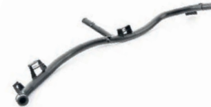
TUBO DE PLÁSTICO DA CIRCULAÇÃO DO LÍQUIDO DE ARREFECIMENTO

VC-123.V AUDI VOLKSWAGEN 04E121070AD 04E121070L