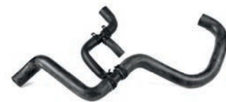
MANGUEIRA SUPERIOR DO RADIADOR

GOLF G3 1.6, 1.8, 2.0 L 8V L4 GASOLINA 94/02