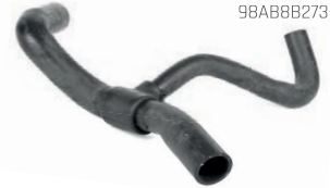
MANGUEIRA INFERIOR DO RADIADOR

VM-0012 FORD 2M5Z8286BC 98A88B273BG 98A88B273BJ