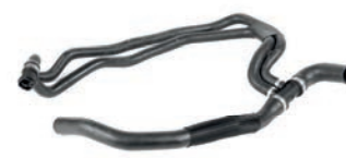
MANGUEIRA INFERIOR DO RADIADOR C/ ACD

CLIO 1.0 L 16V SOHC L4 (D4D) GASOLINA 01/06