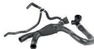
MANGUEIRA INFERIOR E SUPERIOR DO RADIADOR

GOLF TSI 1.4 L 16V L4 (EA211) GASOLINA 13/20 JETTA TSI 1.4 L 16V L4 (EA211) GASOLINA 19/23