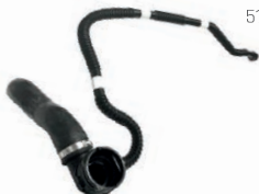
MANGUEIRA INFERIOR DO RADIADOR

VM-2003.A FIAT JEEP 52043649 52129212 51976072