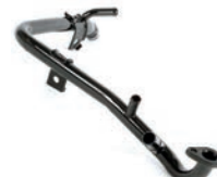
TUBO DE FLUXO DE LÍQUIDO DE ARREFECIMENTO

TUCSON 1.6 L 16V L4 (GAMMA) GASOLINA 21/24 KONA 1.6 L 16V L4 (GAMMA) GASOLINA 21/25