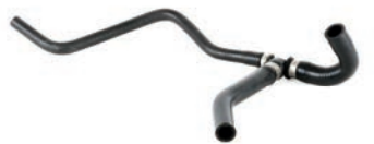
MANGUEIRA DO COLETOR AO TUBO

CORSA 1.4 L 8V (ECONOFLEX, X14YFH) FLEX 07/14 CORSA 1.8 L 8V (FLEXPOWER) FLEX 03/10 MONTANA 1.4 L 8V (ECONOFLEX, X14YFH) FLEX 07/23 MONTANA 1.8 L 8V (FLEXPOWER) FLEX 03/10