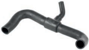
MANGUEIRA DO RADIADOR INFERIOR DA BOMBA DE ÁGUA AO TUBO RÍGIDO - COM AR

GOL 1.6, 1.8, 2.0 L 8V SOHC L4 (AP) 94/09 PARATI 1.6, 1.8, 2.0 L 8V SOHC L4 (AP) 98/09 SAVEIRO 1.6, 1.8, 2.0 L 8V SOHC L4 (AP) 94/09