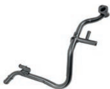
TUBO DE FLUXO DE LÍQUIDO DE ARREFECIMENTO

HB20 1.0 L 12V DOHC L3 (KAPPA T-GDI) FLEX 16/25