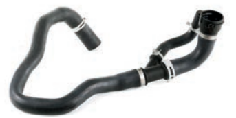
MANGUEIRA INFERIOR DO RADIADOR

DISCOVERY SPORT 2.0 L 16V (ECOBOOST) GAS. 15/16 FREELANDER 2 2.0 L 16V (ECOBOOST) GAS. 13/16 EVOQUE 2.0 L 16V (ECOBOOST) GASOLINA 11/18