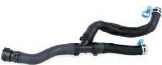
MANGUEIRA SAÍDA AR QUENTE

CRUZE 1.8 L 16V DOHC L4 (ECOTEC 6) FLEX 11/16