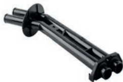
TUBO DE FLUXO DE LÍQUIDO DE ARREFECIMENTO

206 1.6 L 8V SOHC L4 (TU5JP4) FLEX.GAS. 99/10 206 1.4 L 8V SOHC L4 (TU3JP) FLEX.GAS. 04/10 207 1.4 L 8V SOHC L4 (TU3JP) FLEX 08/15 207 1.4 L 8V SOHC L4 (TU3JP) FLEX 08/15