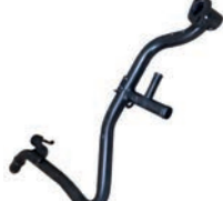
TUBO DE FLUXO DE LÍQUIDO DE ARREFECIMENTO

HB20 1.0 L 12V DOHC L3 (KAPPA T-GDI) FLEX 16/25