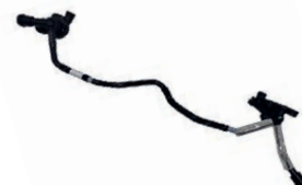
MANGUEIRA / TUBO DISTRIBUIDOR DE LÍQUIDO DE ARREFECIMENTO

AMAROK 3.0 L 24V DOHC V6 (EA897) DIESEL 18/26