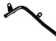
TUBO DO FLUXO DE ÁGUA DA SAÍDA DA FLANGE

HILUX 2.8 L 16V DOHC L4 (1GDFTV) DIESEL 16/22